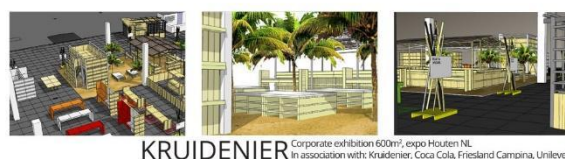
KRUIDENIER Corporate exhibition 600m 2 , expo Houten NL In association with: Kruidenier, Coca Cola, Friesland Campina, Unilever