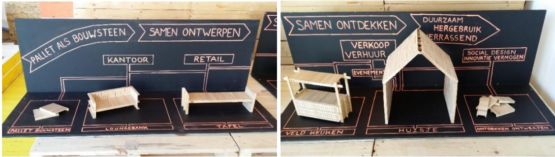
Deze infographic is gemaakt in 2013 en nog steeds passend.